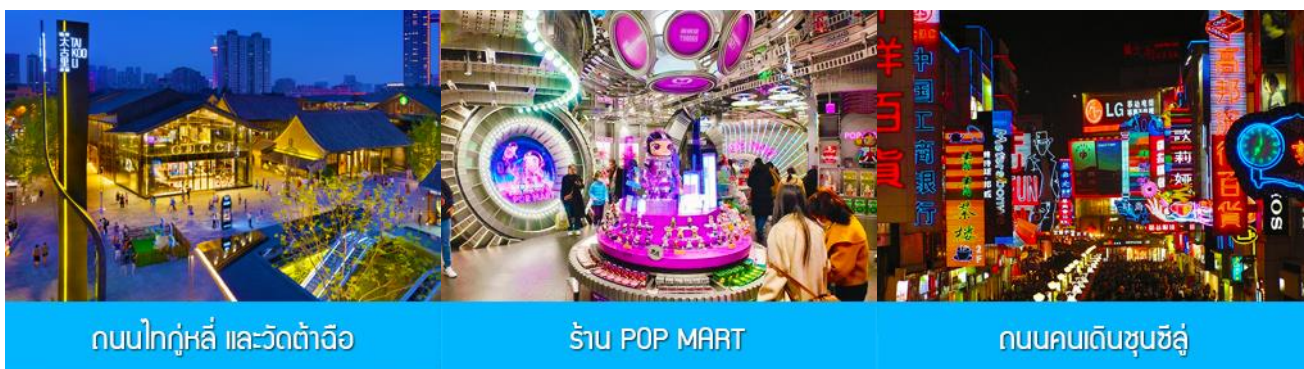
ถนนไท่กู่หลี่ และวัดต้าฉือ

พักที่ โรงแรม SERENGETI HOTEL ระดับ4 ดาวห้องดีนหรือเทียบเท่า