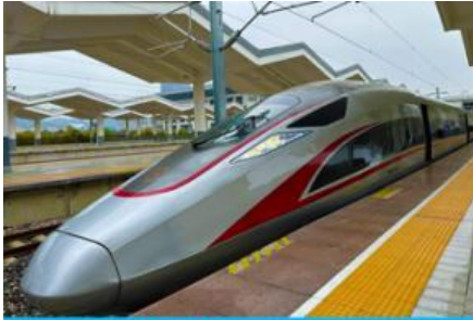
นั้รรถไฟความเร็วสูง