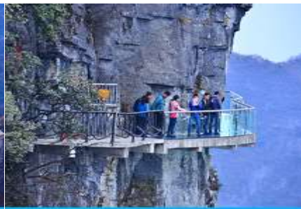
หน้าพลาวยฟ้าทางเดินกระจก