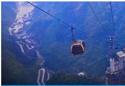
กระเช้าขึ้นเทียนเหมินซาน

โรงแรมระดับ 4 ดาวท้องถิ่นหรือเทียบเท่าในเมืองฟงหวง