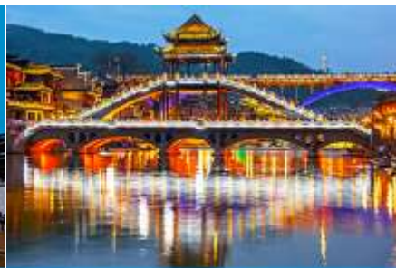
สะพานหงเจียว

วันที่ 1 เที่ยวชมเมืองโบราณฝูหรงเจิน-เดินทางสู่เมืองโบราณเฟิงหวง- เที่ยวชมย่านเมืองเก่าเมืองโบราณเฟิงหวง