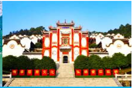
บ้านเกิดกวี ชวีหยวน