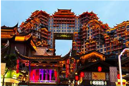
ตึกมหัศจรรย์ 72 ชั้น

รับประทานอาหารค่ำ ณ ภัตตาคาร (อาหารมื้อพิเศษ Wedding Banquet) พักที่ YICHANG MEIJI BOYUE HOTEL โรงแรมระดับ 4 ดาวหรือเทียบเท่าในเมืองหยีซัง