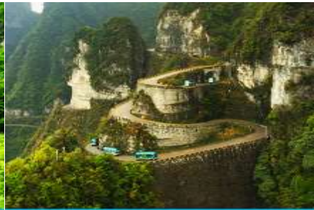
เส้นทาง 99 โค้ง

จากนั้นนำท่านสู่ โพรงประตูสวรรค์ 天门洞 โดย บันไดเลื่อนที่สร้างขึ้นโดยการเจาะทะลุภูเขา 穿山手扶梯 มีความสูงถึง 7 ชั้น เป็นสิ่งอำนวยความสะดวกใหม่ล่าสุดของ เขาเทียนเหมิน ซึ่งหาดูได้ยากตามแหล่งท่องเที่ยวต่างๆ ทั่วโลก บริเวณนี้ ท่านจะได้ถ่ายภาพ ประตูสวรรค์ อย่างใกล้ชิด โดยในปี 1990 มีนักบินผาดโผนชาวรัสเซียขับเครื่องบิน 3 ลำบินลอดผ่านช่องโพรงหินประตูสวรรค์แห่งนี้พร้อมกัน ภาพประวัติศาสตร์นี้ถูกบันทึกและเผยแพร่ไปทั่วโลก ภูเขาเทียนเหมินซานจึงเป็นที่รู้จักของนักผจญภัยทั่วโลกที่อยากเดินทางมาสัมผัสด้วยตัวเอง..... จากนั้นท่านสามารถทดสอบกำลังขาของท่าน โดยการเดินลงบันได 999 ขั้น เพื่อลงมายังลานกว้างที่เป็นจุดถ่ายรูปด้านล่างของประตูสวรรค์ ท่านที่ไม่ต้องการเดินบันไดลง สามารถใช้บันไดเลื่อนแทนการเดินลงบันได 999 ขั้น ณ ลานกว้างด้านล่างเป็นจุดถ่ายรูปที่ดีที่สุดที่สามารถมองเห็นเขาประตูสวรรค์ได้อย่างชัดเจน จากนั้นนำท่านนั่งกระเช้าลงจากเขาเทียนเหมินซาน