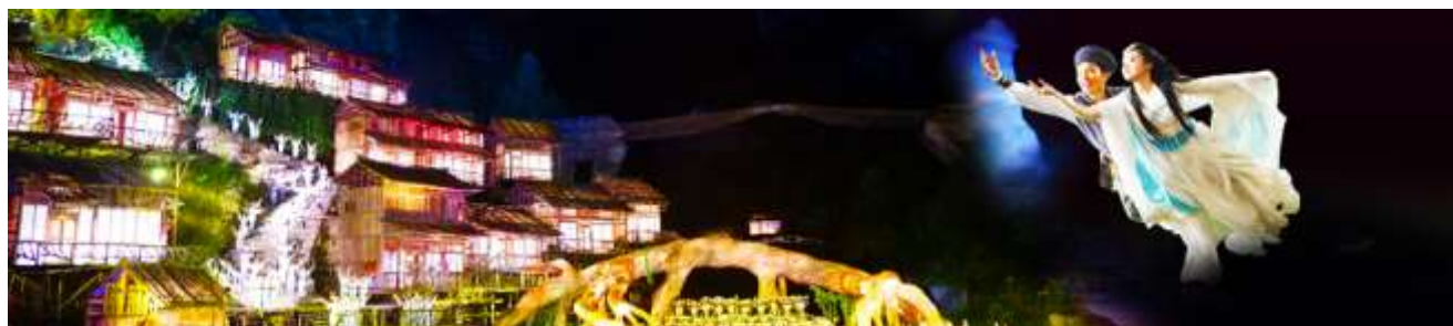
The Love Story of a Wooden Man and Fairy fox

จากนั้นนำท่านสู่ โพรงประตูสวรรค์ 天门洞 โดย บันไดเลื่อนที่สร้างขึ้นโดยการเจาะทะลุภูเขา 穿山手扶梯 มีความสูงถึง 7 ชั้น เป็นสิ่งอำนวยความสะดวกใหม่ล่าสุดของ เขาเทียนเหมิน ซึ่งหาดูได้ยากตามแหล่งท่องเที่ยวต่างๆ ทั่วโลก บริเวณนี้ ท่านจะได้ถ่ายภาพ ประตูสวรรค์ อย่างใกล้ชิด โดยในปี 1990 มีนักบินผาดโผนชาวรัสเซียขับเครื่องบิน 3 ลำบินลอดผ่านช่องโพรงหินประตูสวรรค์แห่งนี้พร้อมกัน ภาพประวัติศาสตร์นี้ถูกบันทึกและเผยแพร่ไปทั่วโลก ภูเขาเทียนเหมินซานจึงเป็นที่รู้จักของนักผจญภัยทั่วโลกที่อยากเดินทางมาสัมผัสด้วยตัวเอง..... จากนั้นท่านสามารถทดสอบกำลังขาของท่าน โดยการเดินลงบันได 999 ขั้น เพื่อลงมายังลานกว้างที่เป็นจุดถ่ายรูปด้านล่างของประตูสวรรค์ ท่านที่ไม่ต้องการเดินบันไดลง สามารถใช้บันไดเลื่อนแทนการเดินลงบันได 999 ขั้น ณ ลานกว้างด้านล่างเป็นจุดถ่ายรูปที่ดีที่สุดที่สามารถมองเห็นเขาประตูสวรรค์ได้อย่างชัดเจน จากนั้นนำท่านนั่งกระเช้าลงจากเขาเทียนเหมินซาน