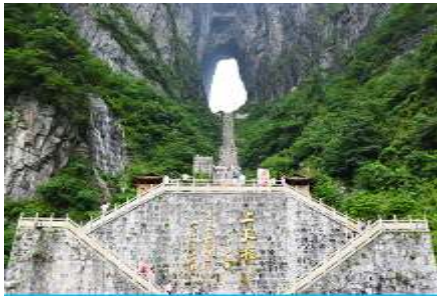
ประตูสวรรค์