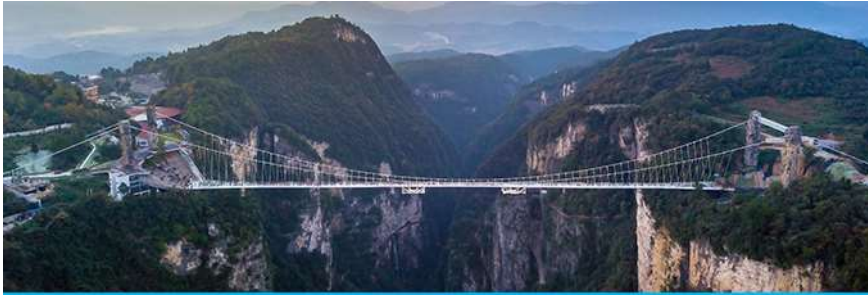
สะพานกระจกจางเจียเจีย

อัตราค่าบริการสำหรับโปรแกรมเสริมการแสดงชุด The love Story of Wooden man and Fairy Fox ท่านละ 400 หยวน (หรือ 2,000 บาทขึ้นอยู่กับอัตราแลกเปลี่ยน) ระยะเวลาที่ใช้ในการเที่ยวชมการแสดง ประมาณ 3 ชั่วโมง รวมเวลาเดินทางไป กลับค่าบริการรวม ค่าบัตรเข้าชม ค่ารถรับ ส่ง และค่าน้ำทิพย์ของไกด์ท้องถิ่น พักที่ GUIYUANZHENPIN HOTEL โรงแรมระดับ 4 ดาวหรือเทียบเท่า