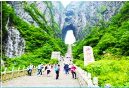
บันได 999 ขั้น