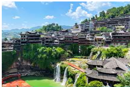
เมืองโบราณฝูหรงเจิน

https://hk.trip.com/hotels/guzhang-hotel-detail-68614854/chaxitai-holiday-hotel/