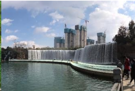
สวนน้ำตก Kunming Waterfall Park