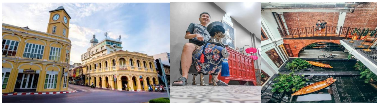
พักค้างคืน (2) โรงแรม ภูเก็ต เมอร์ลิน หรือ เทียบเท่า ปรับอากาศห้องละ 2-3 ท่าน)

วันที่สี่ ภูเก็ต-พระธาตุอินแขวน-โรงงานมุก-โรงงานเม็ดมะม่วง-แม่จู้-สะพานสารสิน-สุราษฎร์ธานี B / - / -