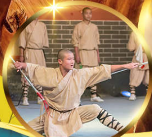
วัดเส้าหลิน