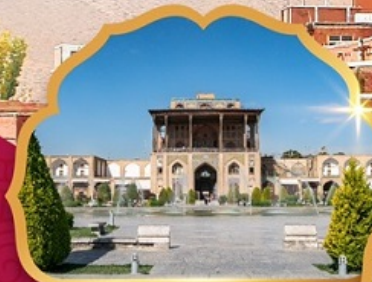
Ali Qapu Palace