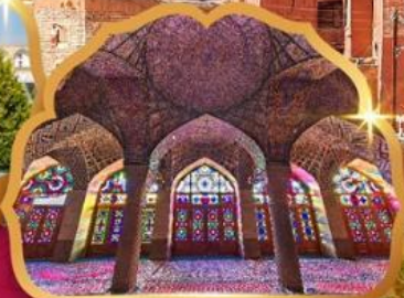
Nasir al Molk Mosque