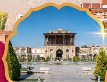
Ali Qapu Palace