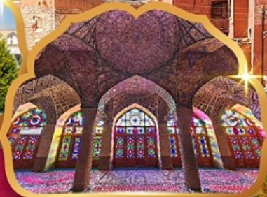
Nasir al Molk Mosque