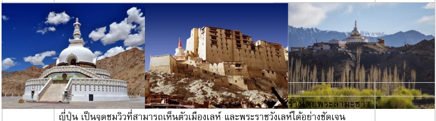
ญี่ปุ่น เป็นจุดชมวิวที่สามารถเห็นตัวเมืองเลห์ และพระราชวังเลห์ได้อย่างชัดเจน