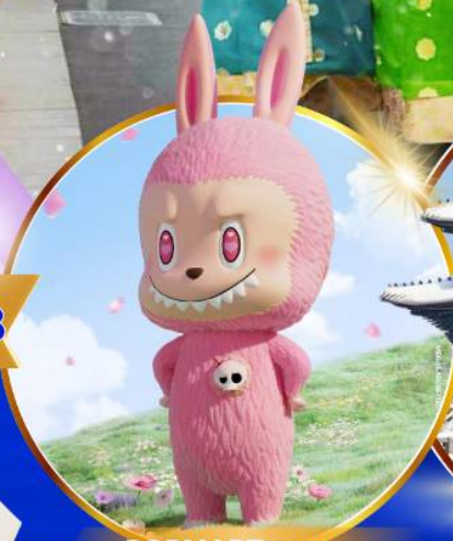
POP MART ฮงแด