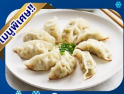
เมนูเกี๊ยวตงเป็ย

พักโรงแรม 4 ดาว ★★★★★ ฟรี ประกันอุบัติเหตุ บริการอาหารท้องถิ่น