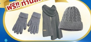
ถุงมือ หมวก ผ้าพันคอ และถุงร้อน