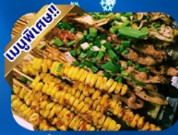
บิงย่างสไตลิ่ง