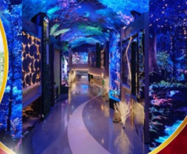
คาเฟ่ดัง Forest Outing