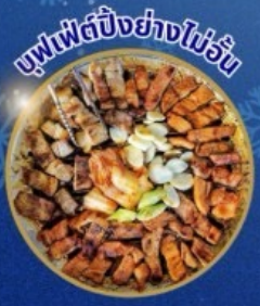
บุฟเฟ่ต์ปิ้งย่างไม่วัน