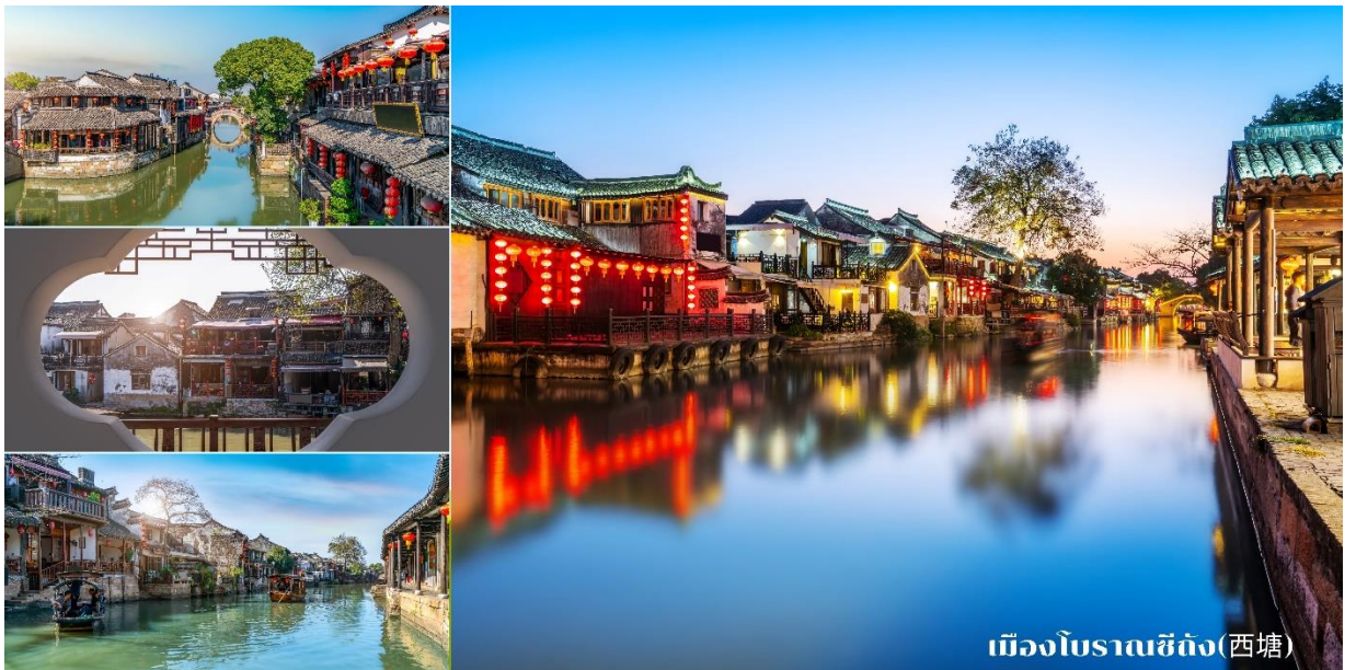
เมืองโบราณซีถัง(西塘)

ได้เวลาอันสมควรนำท่านเดินทางสู่ เมืองโบราณซีถัง(西塘) สถานที่เที่ยว5A เป็นเมืองโบราณที่มีรูปแบบของผังเมืองอันเป็นเอกลักษณ์ ด้วยว่ามีลักษณะทางกายภาพของเมืองที่อยู่กลางสายน้ำ มีสะพานตรอกซอย และระเบียบทางเดินจำนวนมาก เชื่อมอยู่ทั่วตลอดทั้งเมือง โดยตรอกทางเดินในเมืองมีทั้งสั้นและยาวมีทั้งแคบและกว้าง แตกต่างกันไป สามารถเดินเที่ยวชมสัมผัสวิถีชีวิตชาวเมืองได้อย่างสบายไร้กังวล บ้านเรือนที่อยู่อาศัยแต่ละหลังยังคงความดั้งเดิมไว้ บางหลังก็มีการประดับตกแต่งด้วยโบราณวัตถุสวยงาม สอดประสานกับกลิ่นอายความคลาสสิกของเมืองได้เป็นอย่างดี