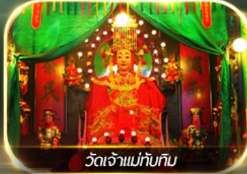
วัดเจ้าแม่กัมทิม