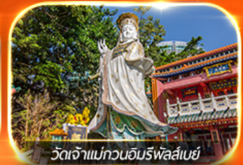
วัดเจ้าแม่กวนอิมทิฟลีย์

รวมตั๋วดิสนีย์แลนด์+รถรับ-ส่ง ซอปปิงแบบจัดเต็ม พักย่านจิมซาจุ่ย