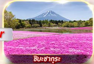
ชิบะชาคุระ