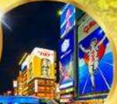
ช้อปปิ้ง ชินไซบาชิ

ราคา เริ่มต้น 26,919 บาท รวมภาษีมูลค่าเพิ่ม 7%