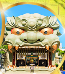
ศาลเจ้า ฟุชิมิ อินาริ