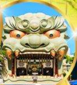
ศาลเจ้า นัมมะ ยาชากะ