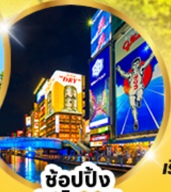
ช้อปปิ้ง ชินไซบาชิ