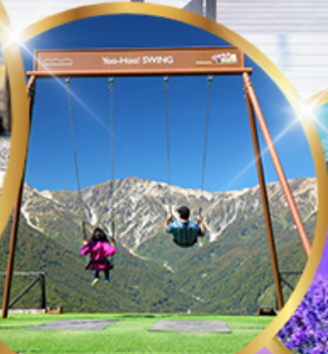
ชิงช้า Yoo hoo! Swing