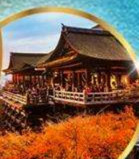
วัดคิโยมิสึ