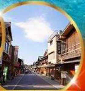
ถนนคนเดินฮิสะ