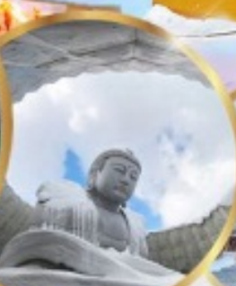
เนินเขาแห่งพระพุทธรเจ้า