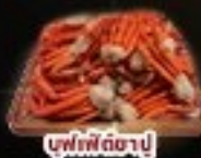
บุฟเฟ่ต์ฮายาบู