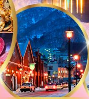
โถดิงฮิยูแดง