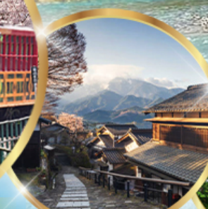
มาโกเมะจุกุ