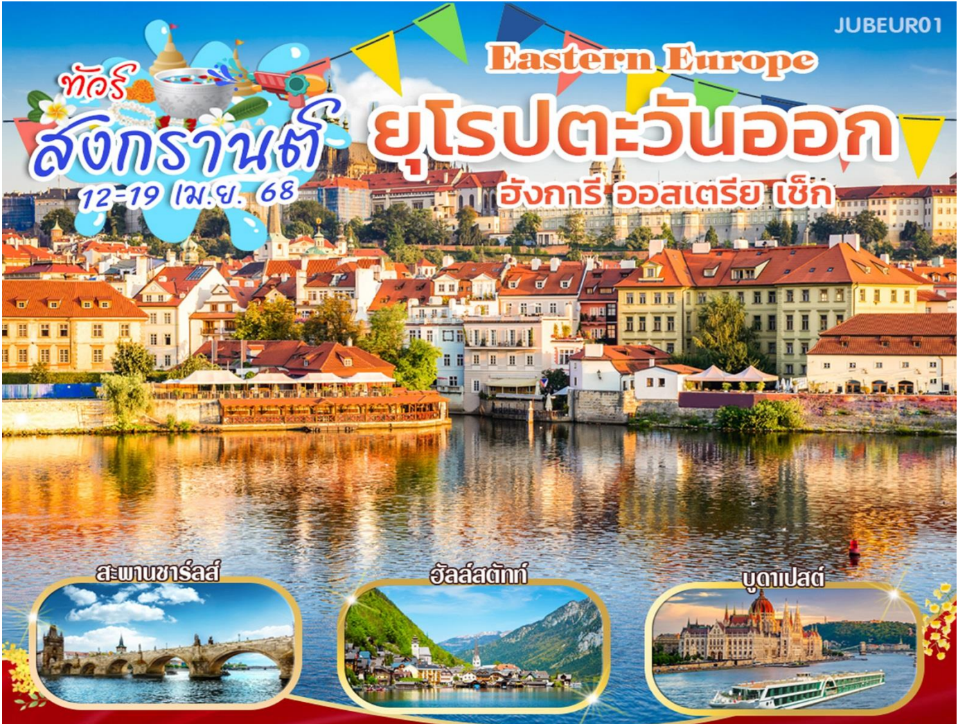
สะพานชาร์ลส์