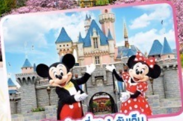
อิสระท่องเที่ยว 1 วันเต็ม