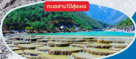
ทะเลสาบไ้สู่ยเหอ