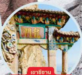
เขาชินชาน รวมกระเช้า+รถแบคเตอร์