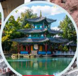
สระมังกรคำ