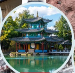
สระมังกรดำ