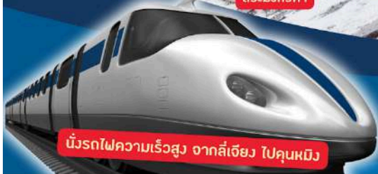
นั้งรถไฟความเร็วสูง จากลี่เจียง ไปคุณหมิง