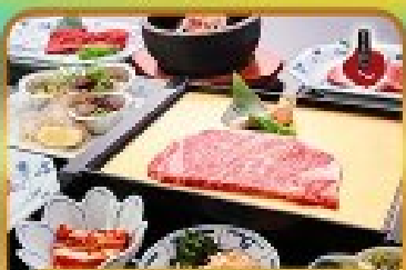
บั้งย่าง ROKKASEN