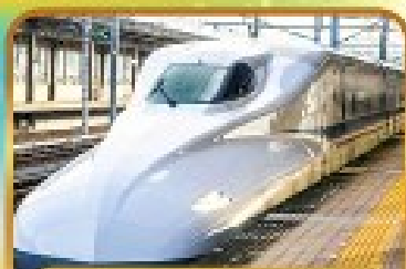
สัมผัสนั้งชินกันเซน