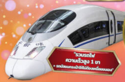
"รวมรถไฟความเร็วสูง 1 ท + รถบริการเข้าที่พักเมืองหนิงชอง"