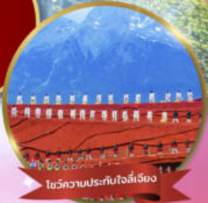
โชว์ความประทับใจลี่เจียง