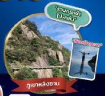
ภูเขาหลิงซาน

หมู่บ้านเทวดาวังเซียนถู่ หมู่บ้านที่ตั้งอยู่ริมหน้าผา สองเรือชมวิวยามค่ำคืนที่ฉูหนีโจว หมู่บ้านโบราณหวงหลิง - ภูเขาหลิงซาน - ถ้องฟ้ากระจก ถนนคนเดินหนานซาง - วัดโคฝู - ถนนคนเดินหวงซิงลู่