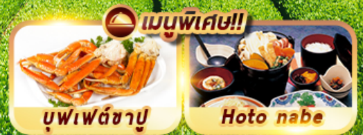
บุฟเฟ่ต์ซาบู่