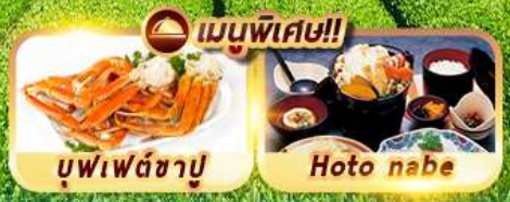
บุฟเฟ่ต์ซาปู