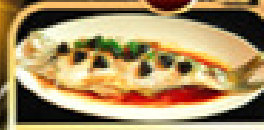
ปลาประจักษ์