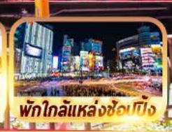
พักใกล้แหล่งช้อปปิ้ง