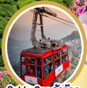
Cable Car กิ่งตอก