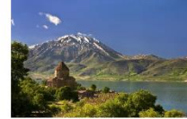
เมืองวาน