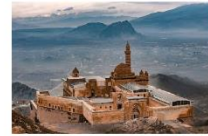
พระราชวังอิซฮาก พาชาร์