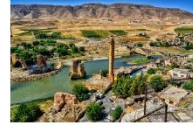
เมืองฮาซันคีฟ