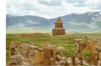
เมืองเอนิชม

15.25-17.50 น. เห็นฟ้ากลับสู่อิสตันบูล โดยสายการบิน TURKISH AIRLINES เที่ยวบินที่ TK 2717 (บินภายในประเทศ)