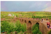
สะพานสิบโค้ง