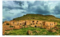
เมืองดารา