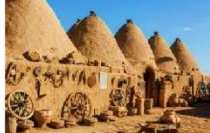
บ้านแบบรวงผึ้ง