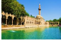
ถ้ำอับราฮัม