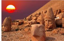
ชมพระอาทิตย์ตกดิน