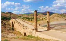
สะพานเซเวอร์ริน