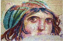
พิพิธภัณฑสถานแห่งชาติซูมา โมเสก