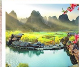
เมืองลิบไถ่