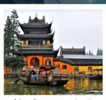
หมู่บ้านโบราณจูเจียเจียว

สวนสนุกยูนิเวอร์แซลปักกิ่ง / สวนสนุกเซี่ยงไฮ้ดิสนีย์แลนด์ / หมู่บ้านโบราณจูเจียเจียว ขึ้นหอไข่มุก / ลอดอุโมงค์เลเซอร์ / หาดไว่ทาน / จัดธุริศเทียนอันเหมิน พระราชวังโบราณกู่กง / กำแพงเมืองจีนด่านจี้หยงกวน สนามกีฬาโอลิมปิกปักกิ่ง / ถนนโบราณเจียนเหมิน