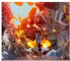
SPACE & TIME CUBE