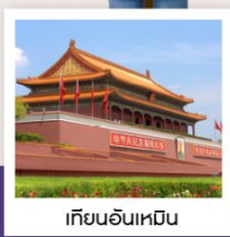
เทียนอันเหมิน

กำแพงเมืองจีนด่านจวิหยงกวน / สนามกีฬาปักกิ่ง / ช้อปปิ้งย่านซานหลี่ตุ่น / วัดลามะ จัตุรัสเทียนอันเหมิน / พระราชวังโบราณกู้กง / หอประชุมเทียนถาน / พระราชวังฤดูร้อนอวิ๋เหอหยวน