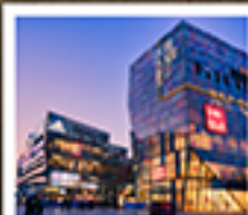
ย่านซานหลี่ตุ๋น