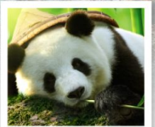
ศูนย์หมีแพนด้า

อุทยานหวงหลง / อุทยานจิวจ้ายโกว / โซ่วทีกบตศูนย์อนุรักษ์หมีแพนด้าตู่เจียงเย่ย์ / สวนดอกไม้สี่ฤดู / ระเบียบแก้ว / ถนนคนเดินซุนซีลู่ / ถนนโบราณจิ้นหลี่