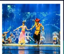
โชว์เซียนกู่จิง