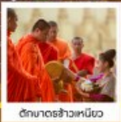
วัดมหาธาตุเจ้าเมือง