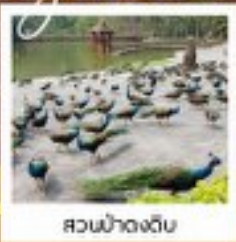
สวนน้ำดงดิบ