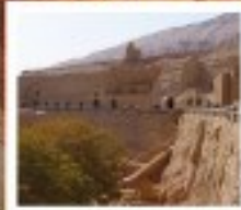
ถ้ำพระผืนธง

ถู่หลู่ฟาน / ตุนหวง / จางเย่ / หลานโจว / อุหลู่มู่ฉี / เจิงตุ