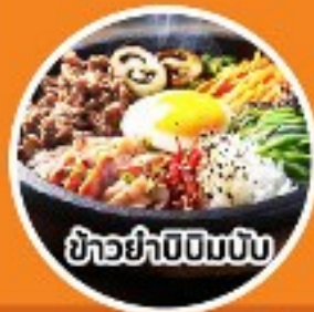
ข้าวยำบีบีมพิบ