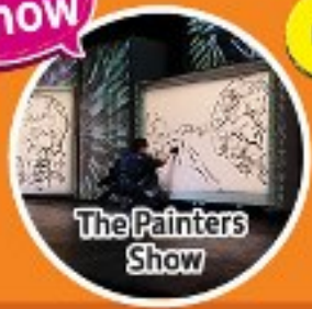
The Painters Show