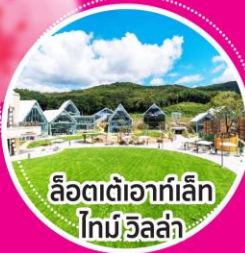
ลือตเต้ออกท์เล็ก โทม็อีลล่า