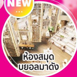
ห้องสมุด บยอลมาดัง