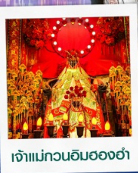
เจ้าแม่กวนอิมสองฮา