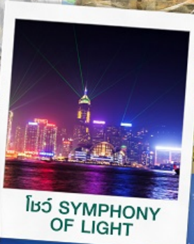
โชว์ SYMPHONY OF LIGHT