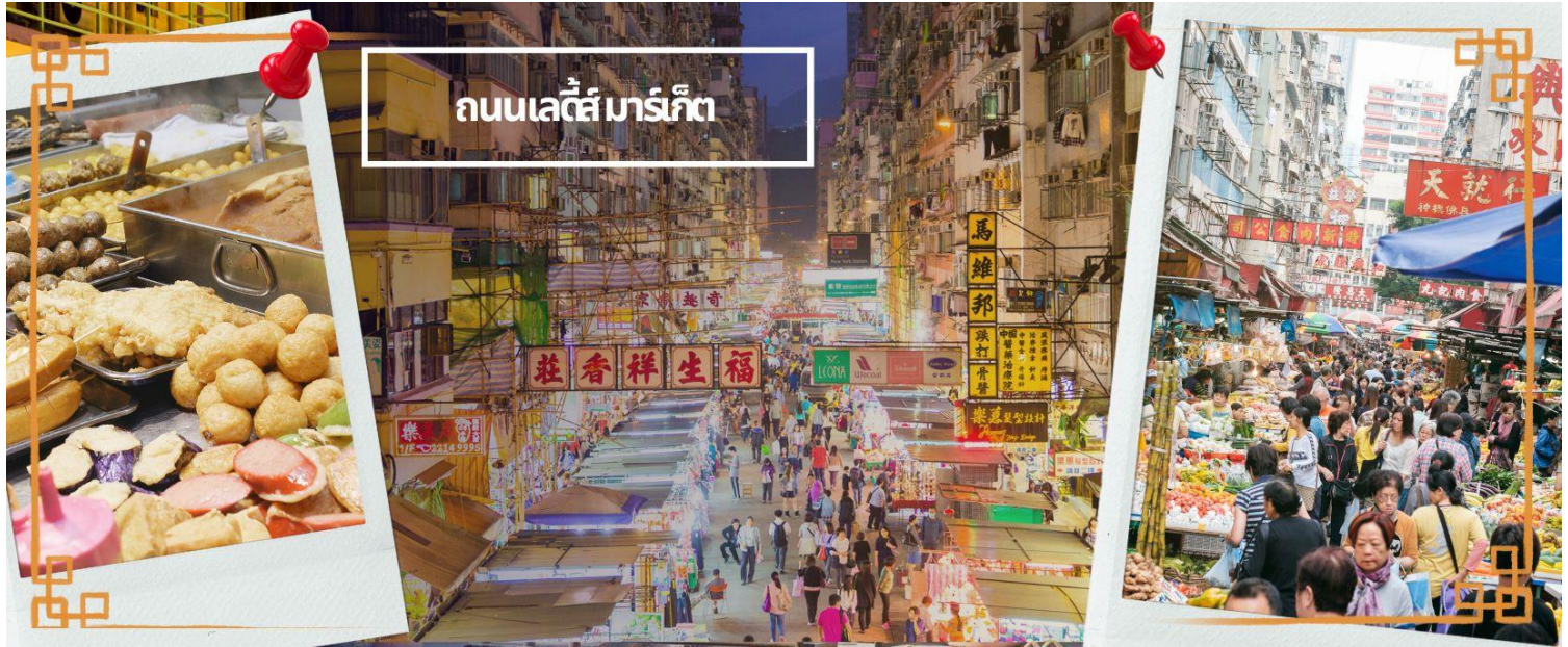
ถนนเลดี้ส์ มาร์เก็ต

ช่วยพัดพาสิ่งชั่วร้ายและโรคภัยไข้เจ็บออกไปจากตัวและนำพาแต่ความโชคดีเข้ามาแทน จากนั้นนำท่านเดินทางสู่ ย่านมงก๊ก เป็นย่านที่มีความคึกคักที่สุดแห่งหนึ่งในเกาะฮ่องกงก็ว่าได้ เป็นสวรรค์ของนักช้อปปิ้งหนึ่งที่ที่สายช้อปจะพลาดไม่ได้ นับได้ว่าเป็นย่านช้อปปิ้งที่คึกคักมากอีกแห่งหนึ่งของฮ่องกงเพราะเป็นย่านช้อปปิ้งที่มีทั้งร้านค้า และคนที่มาช้อปปิ้งจากที่ต่างๆ มากมายไม่ขาดสายตั้งแต่กลางวันยันกลางคืน เป็นถนนช้อปปิ้งที่มีสีสันมาก ถ้าเทียบกับญี่ปุ่นแล้วก็เปรียบเหมือนการเดินทางอยู่ที่ชิบูย่าเลยก็ว่าได้ และยังมี ถนนเลดี้ส์ มาร์เก็ต (LADIES MARKET) ที่มีทั้งเครื่องสำอาง เสื้อผ้า รองเท้า กระเป๋า เครื่องประดับมากมายให้เลือกช้อป อีกทั้งยังมีร้านอาหารและเครื่องดื่ม ที่ขึ้นชื่อหลากหลายชนิด ให้ทุกท่านได้ลองลิ้มรสอีกมากมาย