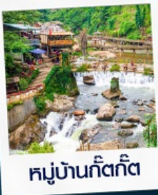
หมู่บ้านก๊ตก๊ต