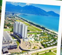
Mikazuki Japanese Resorts & Spa