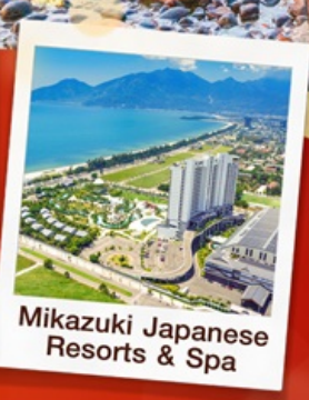
Mikazuki Japanese Resorts & Spa