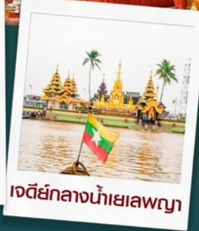
เจดีย์กลางน้ำเยเลพญา