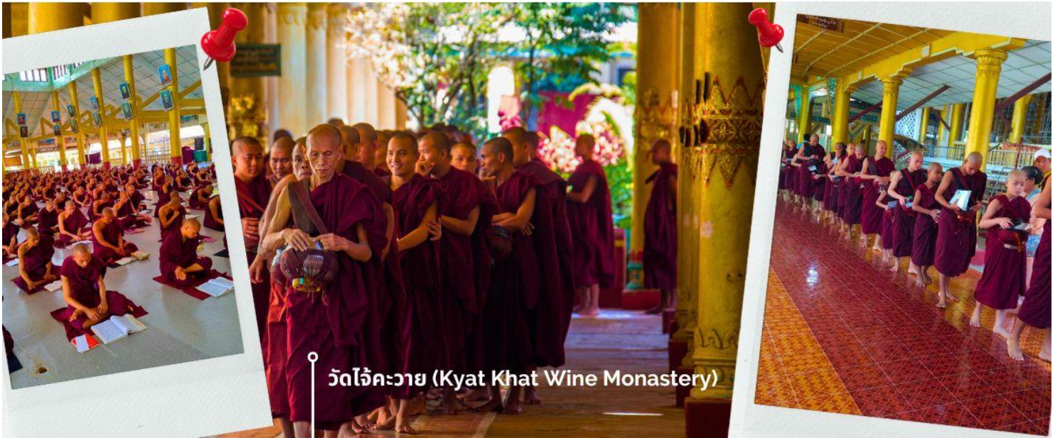
วัดไจ้คะวาย (Kyat Khat Wine Monastery)

นำท่านเดินทางลงจากพระธาตุนรินทร์แขวน โดยใช้เส้นทางเดิม เพื่อมุ่งหน้าสู่เมืองหงสาวดี (ใช้เวลาเดินทางประมาณ 1 ชั่วโมง 30 นาที) เชิญร่วมทำบุญตักบาตรพระสงฆ์ ณ วัดไจ้คะวาย เมืองหงสาวดี มีพระสงฆ์กว่า 1000 รูป เป็นโรงเรียนสอนพระพุทธศาสนา นักรธรรมชั้นตรี โท และ เอก เพื่อศึกษาพระไตรปิฎกเป็นจำนวนมาก ในช่วงสายของทุกวัน พระสงฆ์และเณร จะเดินออกมาบิณฑบาตเพื่อเตรียมฉันเพล โดยวัดแห่งนี้ ได้รับความสนับสนุนจากชาวพุทธในพม่าเองและ นักท่องเที่ยวที่เดินทางมาที่วัด เพื่อทำการถวายเงินปัจจัย หรือ ข้าวสาร รวมไปถึง อุปกรณ์การเรียนและเครื่องเขียนต่างๆ เพื่อใช้ในการ ศึกษาธรรมะของพระสงฆ์และเณรในวัดไจ้คะวายแห่งนี้