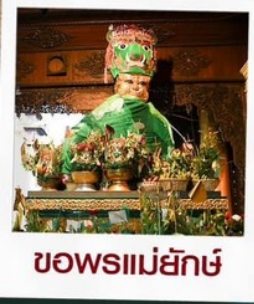
ขอพรแม่ยกษ์