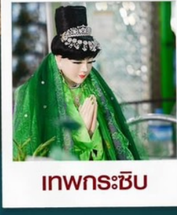
เทพกระซิบ